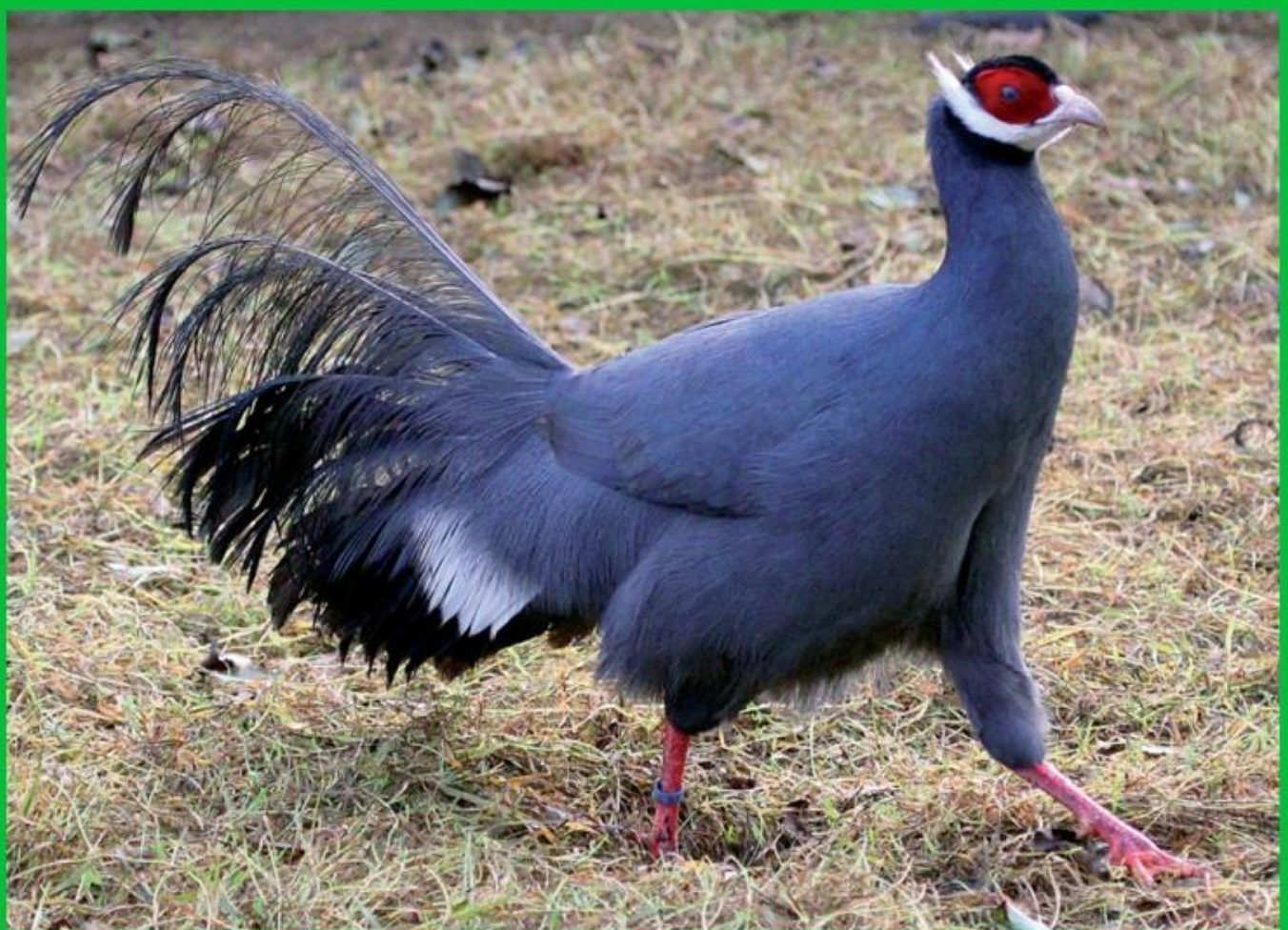
Faisán orejado azul ( crossoptilon auritum )

En cautividad se les suministra un pienso especial